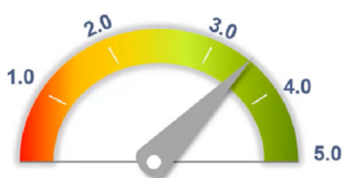
СЭТГЭЛ ХАНАМЖИЙН ИНДЕКСИЙН УТГА