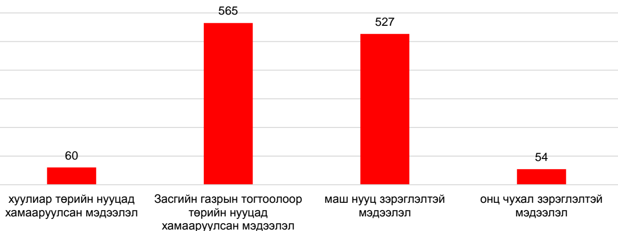
График 1. Төрийн болон албаны нууцын тухай хууль болон Засгийн газрын тогтоолоор төрийн нууцад хамааруулсан мэдээллийн нэгдсэн тоо

МЭДЭЭЛЭЛТЭЙ БАЙХ ЭРХИЙГ ХЯЗГААРЛАЖ БУЙ ХУУЛЬ ТОГТООМЖИЙН ДҮН ШИНЖИЛГЭЭ https://www.gic.mn/public/docs/publications/public_restrictions_right_to_information_act_s_pdf_2019.pdf